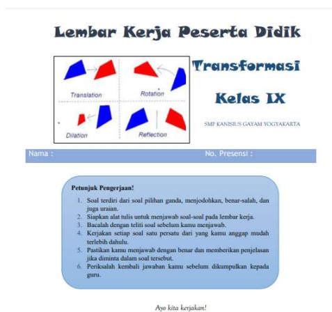
Gambar 1. Halaman sampul LKPD